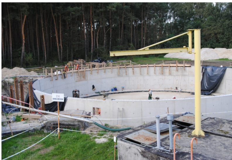
1. Osadnik wtórny - wrzesień

Aktualna sprawność oczyszczalni ścieków w zakresie oczyszczania ścieków nie jest wystarczająca. Przeprowadzana modernizacja zapewni spełnianie dyrektyw europejskich w zakresie jakości ścieków oczyszczonych. W ramach realizacji projektu m.in. remontowana jest komora fermentacyjna (WKF), przeprowadzana jest przebudowa wewnątrz istniejących reaktorów biologicznych. Obecnie trwają intensywne prace przy budowie drugiego osadnika wtórnego, co pozwoli uniknąć ewentualnego zagrożenia środowiska w razie awarii jednego z nich. Wykonawcą największego przedsięwzięcia Projektu jest firma "INSTAL Kraków" S.A. z Krakowa, z którą podpisano umowę w dniu 9 czerwca 2010 roku. Planowany termin zakończenia zadania - 15.03.2012 roku.