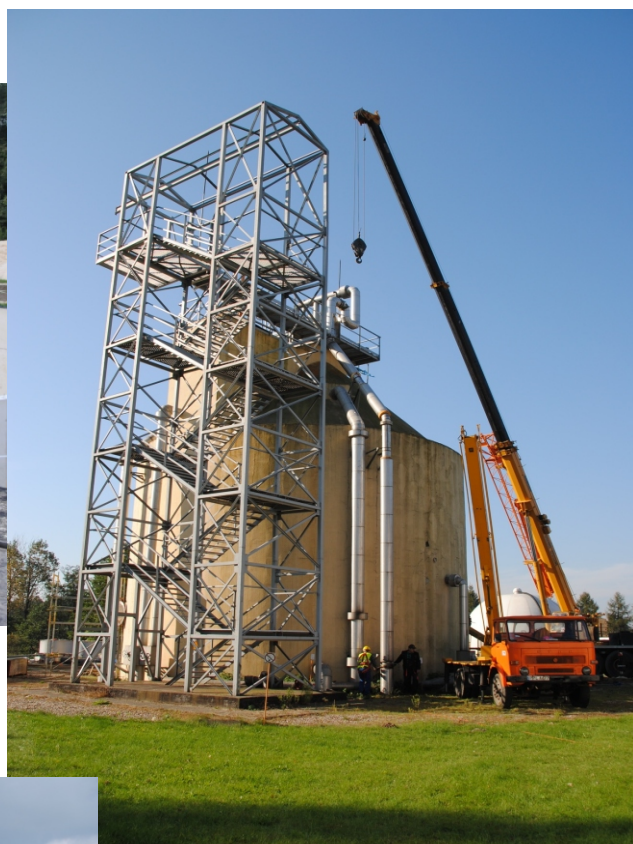
2. Wtórna komora fermentacyjna WKF