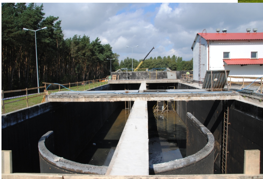
3. Komora biologiczna - wrzesień