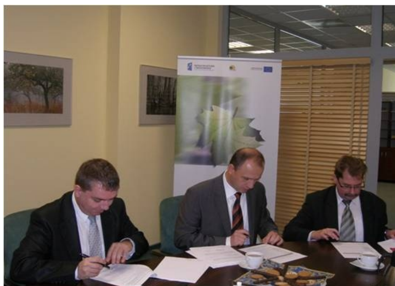
Podpisanie Umowy o dofinansowanie nr POIS.01.01.00-00-083/08-00 w ramach Programu Operacyjnego Infrastruktura i Środowisko 2007- 2013 20.11.2009 roku

Po pozytywnej ocenie Projektu, która miała na celu sprawdzenie rzetelności jego przygotowania tak aby dofinansowanie uzyskały najlepiej przygotowane projekty o największym pozytywnym wpływie na środowisko, nastąpiło uroczyste podpisanie Umowy o dofinansowanie pomiędzy Wojewódzkim Funduszem Ochrony Środowiska i Gospodarki wodnej w Poznaniu a Przedsiębiorstwem Komunalnym Spółka z o.o w Pleszewie - podkreślające wagę wielomilionowego dofinansowania unijnego.